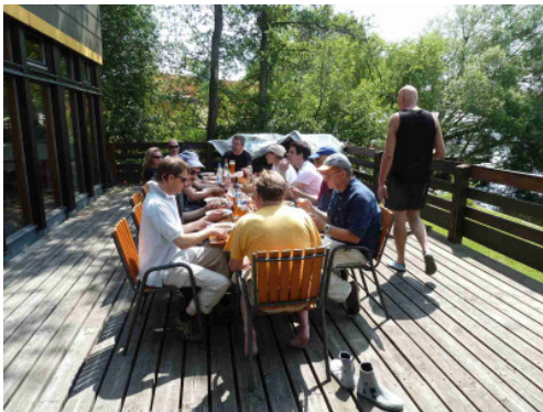
Gemeinsames Essen mit Klönsnak

Den Abend verbrachten wir gemeinsam bei einem gemütlichen Abendessen in der „Gaststätte Bahnhof“ und hatten Zeit, uns auch über das Segeln hinaus etwas kennen zu lernen und auszutauschen.